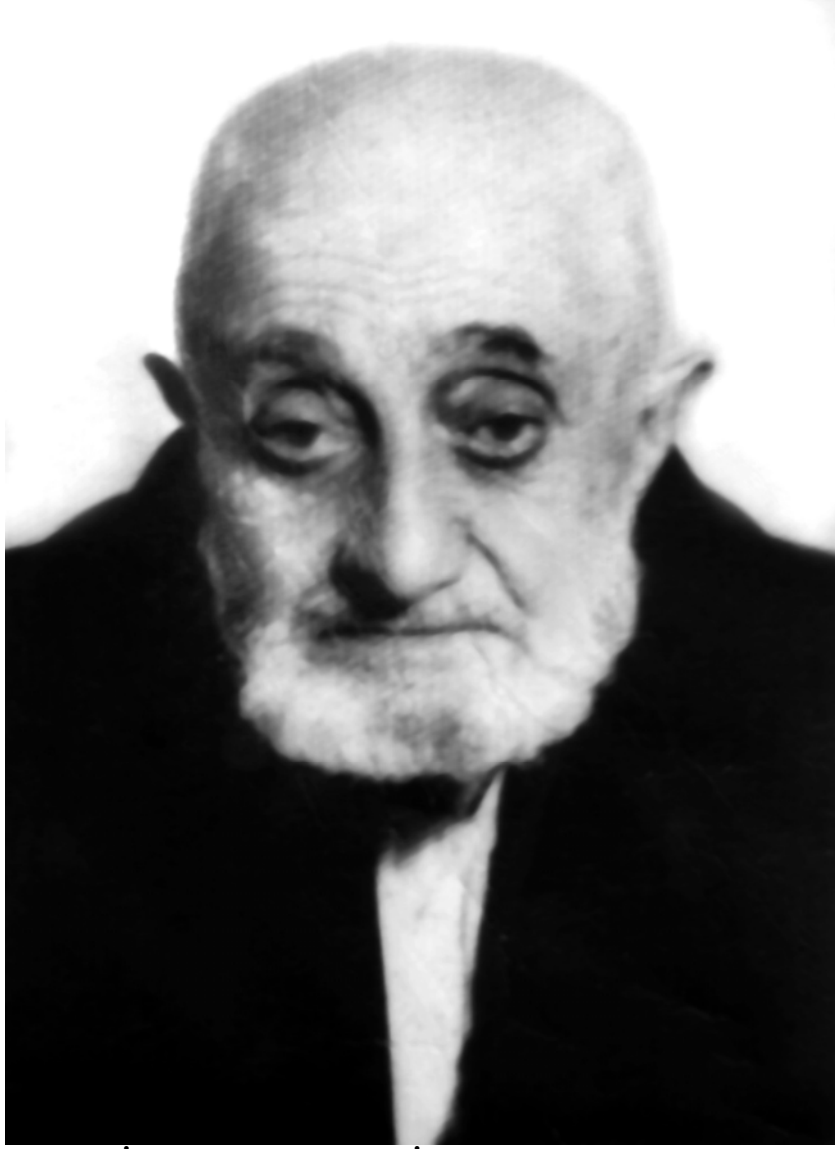
Hacı İsmail Hakkı Toprak İhrâmi kuddise sırruhu'l-azîz